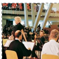
Koncert lunchowy w Filharmonii Berlińskiej