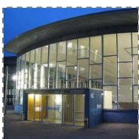
Zwiedzanie wystawy w Pałacu Płaczu (z przewodnikiem)