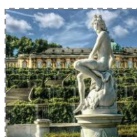
Wyjazd do Poczdamu - Zwiedzanie miasta i Parku Sanssouci