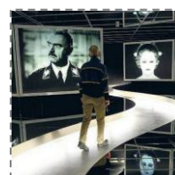
Zwiedzanie Muzeum Filmu i Telewizji