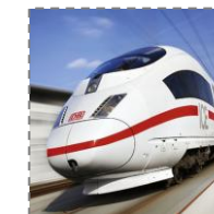
Wyjazd do Polski ze stacji Berlin Lichtenberg