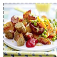
Przerwa obiadowa na Potsdamer Platz