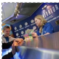
Zakwaterowanie w Hostelku Generator