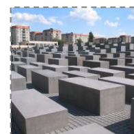
Zwiedzanie wystawy pod Pomnikiem Pomordowanych Żydów Europy