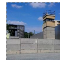
Zwiedzanie Miejsca Pamięci Muru Berlińskiego