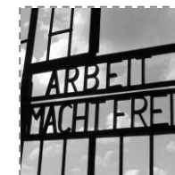
Wyjazd do Oranienburga - Zwiedzanie Miejsca Pamięci Sachsenhausen (z przewodnikiem)