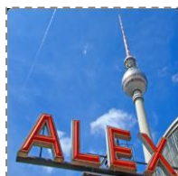
Spacer po Alexanderplatz