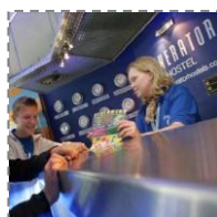
Wykwaterowanie z Hostelku Generator