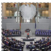
Zwiedzanie Bundestagu (z przewodnikiem)