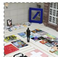
Zwiedzanie Deutsche Bank KunstHalle (z przewodnikiem)