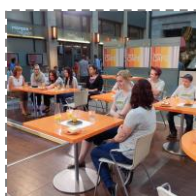
Występ na żywo w programie ZDF Morgenmagazin (plus zwiedzanie studia TV)