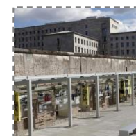
Zwiedzanie Topografii Terroru (z przewodnikiem)