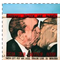
Zwiedzanie East Side Gallery